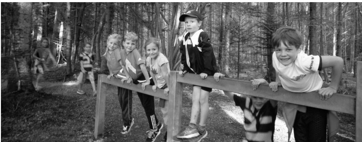
Gruppe U10 auf dem Vitaparcours

In Rücksprache mit den LeiterInnen ist es jederzeit möglich, ein Schnuppertraining zu absolvieren.