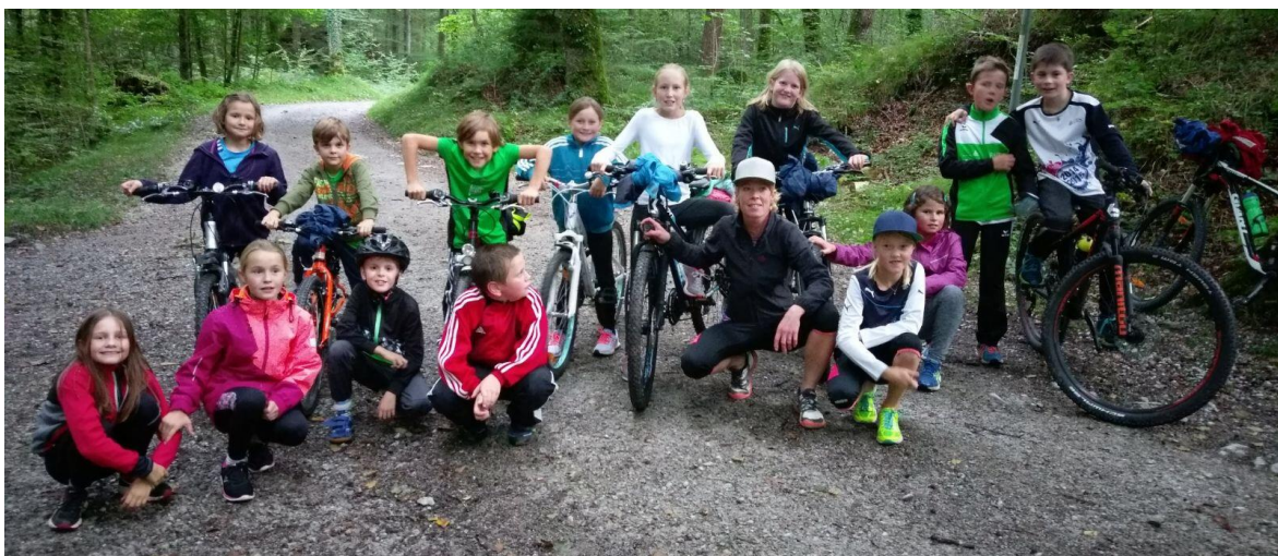
Gruppe U12 beim Training im Kernwald

Im Jahr 2017 haben verschiedene Athletinnen und Athleten von LA Kerns hervorragende Leistungen gezeigt, die anlässlich der Veranstaltung „Kerns ehrt“ gebührend gefeiert werden. Die Geehrten freuen sich sicher über einen grossen Publikumsaufmarsch.